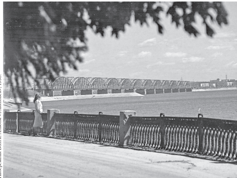
Набережная Волги. Альбом «Ульяновск», 1998.